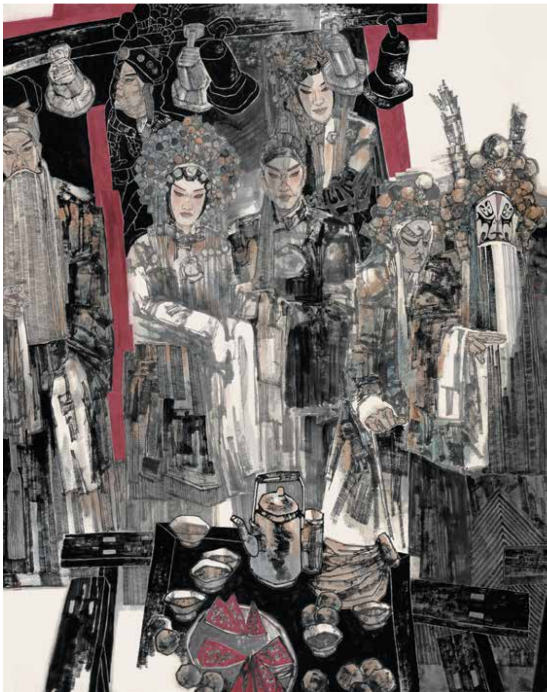
戏里戏外 240×200cm 2019年