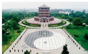
焦作陈家沟太极拳

我省嵩山少林武术、朱仙镇木版年画、方城石猴、陈家沟太极拳等地域特色文化丰厚，发展文创特色小镇既有一定的历史积淀，也具备现实基础。民革河南省委建议我省借鉴日本大荣町柯南小镇、上海迪士尼小镇等成功经验，科学规划建设特色小镇，有机融入地域特色文化，破解当前由于缺乏特色产业支撑而导致的“千镇一面”、运营疲软等现实困局。