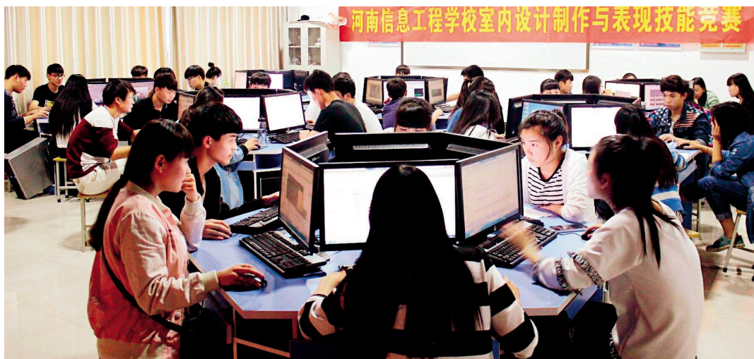
职业教育应积极推行“引企入校，送教进企，订单式培养”等办学模式