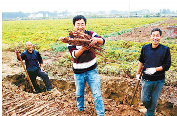
温县赵堡镇种植专业合作社铁棍山药喜获丰收

推动乡村绿色发展、解决废弃物的资源化高效利用是当前亟待解决的问题。民革河南省委建议“两步走”齐头并进：一方面，提高废弃物分类知识普及程度，完善法规、细化政策，将废弃物收集、存贮、利用落到实处；另一方面，支持废弃物再利用企业发展，推动农村废弃物资源化高效利用环保产业的快速、高效、持续发展。