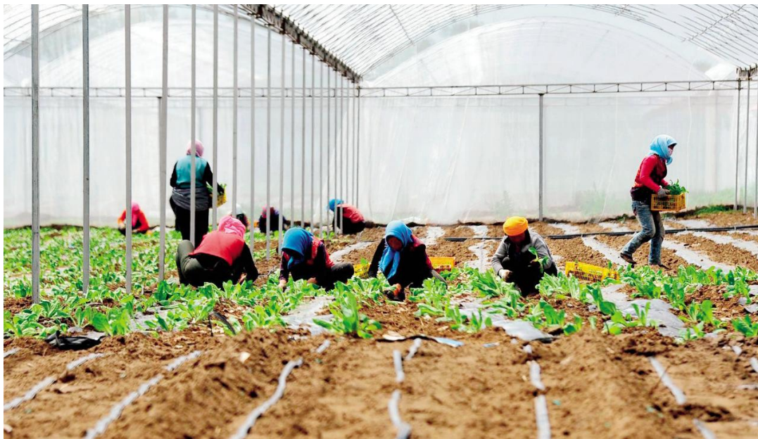
助力贫困地区发展现代农业、特色农业，带动贫困人口脱贫致富

品结构现状？民进省委组织相关人员在深入调研分析后提出，建立由政府、高校和产业结合的“专利扶贫联盟”，创建涵盖“官产学研用”的专利扶贫协同机制。